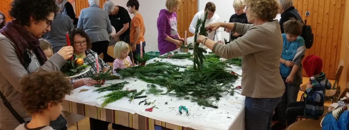
Jul i Norden