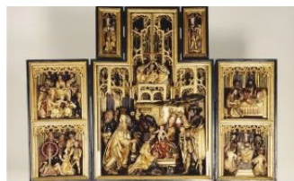
Altartavlen i Ulkebøl kirke

Vi læser litteratur fra Norden og vil i år fortrinsvis læse danske forfattere.