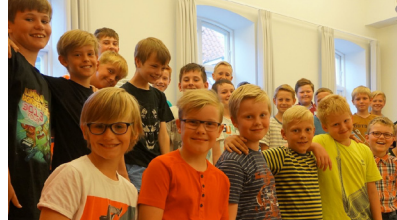
Haderslev Drengekor vil synge julen ind