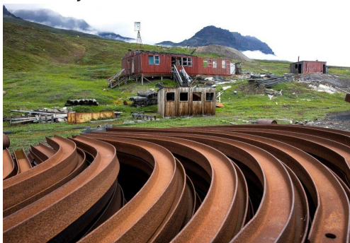
Qullissat.