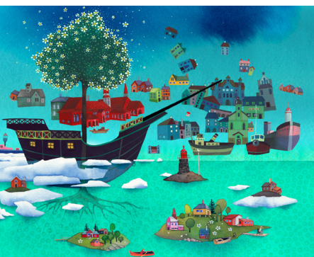
Årets plakater til Skumringstid.

Rundvisning på Vadehavscentret, Okholmvej 5, Vester Vedsted, 6760 Ribe. Se side 4.