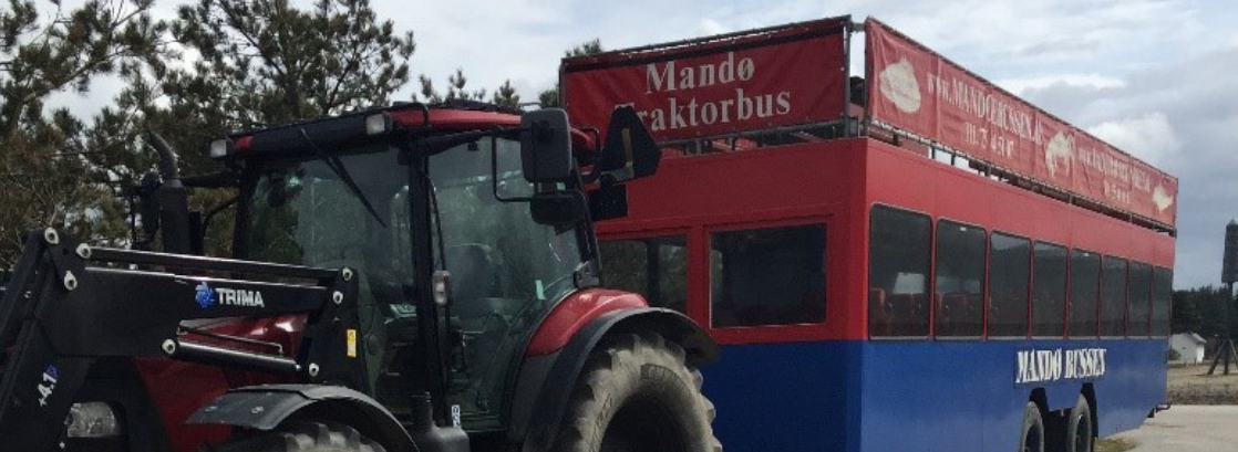
Traktorbus til Mandø

Pris: medlemmer 280 kr. – ikke-medlemmer 310 kr.