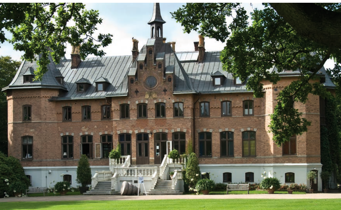
Sofiero Slot.

Nærmere oplysninger om dato, tidspunkt, kørsel og evt. frokost meddeles senere.