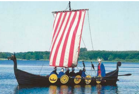
Vikingskib på Jels sø skaber Vikingestemning.

Brødremenighedens Hotel, Lindegade 25, Christiansfeld. (Nærmere annoncering senere.)