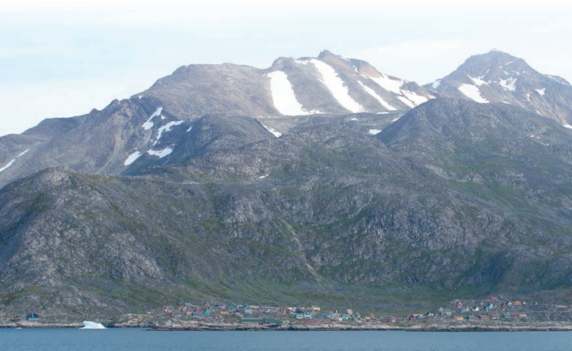
Arsuk set fra havet.

Venskabsrejse til Arsuk/Grønland. Vi kender pt. ikke hverken tidspunkt eller form, men kan sandsynligvis i oktober/november komme med flere oplysninger.