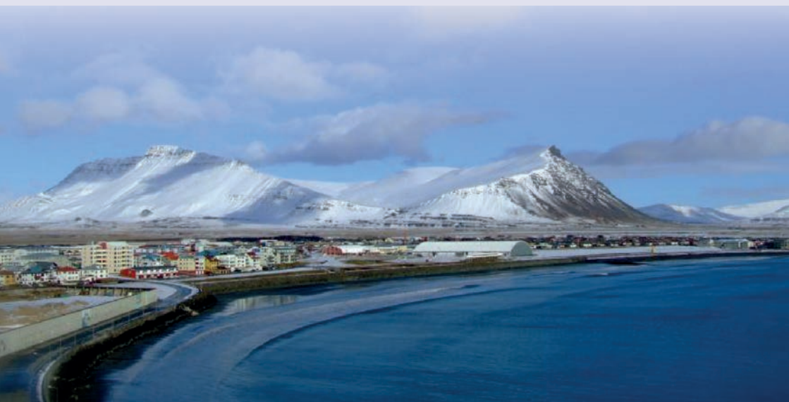
Akranes om vinteren